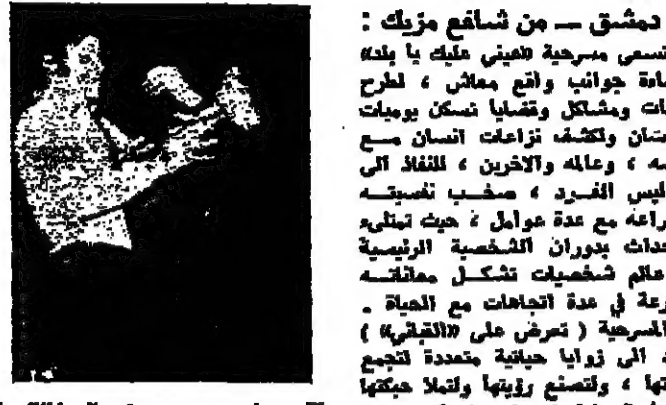
سامي وسوسو : عالم المثالية